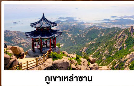
ภูเขาเหล่าซาน