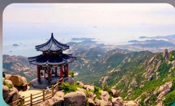
กูเจาเหลาซาน