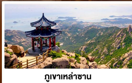
ภูเขาเหล่าซาน