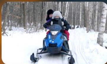
จักรยาน SNOW MOTORCYCLE