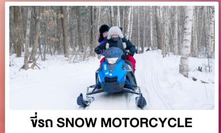
ขี่รถ SNOW MOTORCYCLE