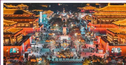
ถนนวัฒนธรรมราชวงศ์ถัง