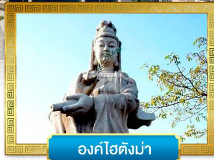
องค์ไฮตังม่า