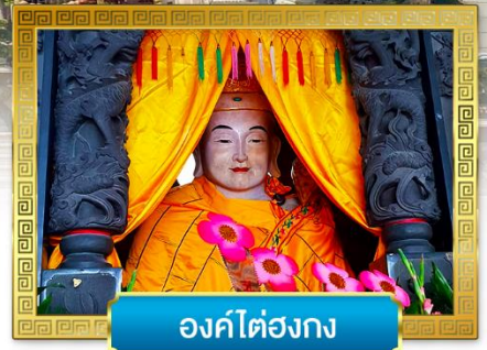
องค์ไต๋องกง