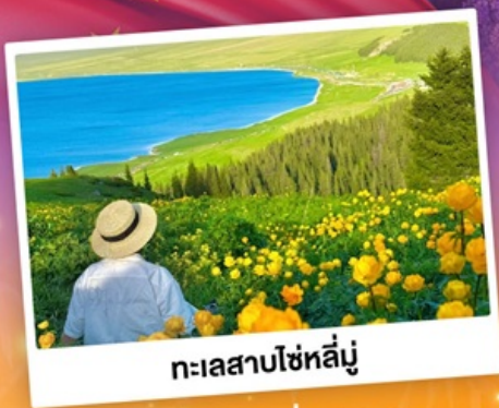
ทะเลสาบโซห์ลีมู่

ถ่ายรูปทุ่งดอกลาเวนเดอร์ - กุ้งหญ้าคาลาจัน SKY GRASSLAND กุ้งหญ้าบรมกโลก