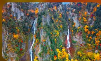
น้ำตกกิงกะ และน้ำตกริวเซ