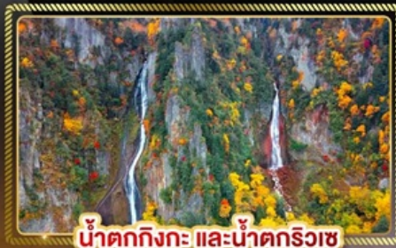
น้ำตกทิงกะ และน้ำตกริวซ