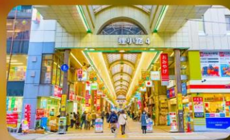
ซุปป์ิงถนนทากูกิโคจิ