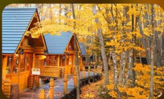
หมู่บ้านนิงเกิ้ลทอเรซ