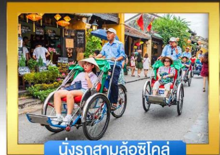
นั่งรถสามล้อชิโคล์