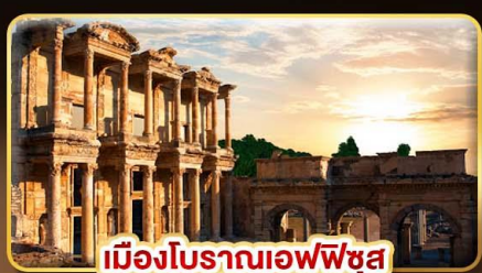
เมืองโบราณเอฟเฟซุส