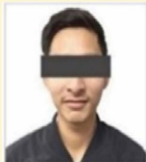
รูปถ่าย ขนาด 2*2 นิ้ว