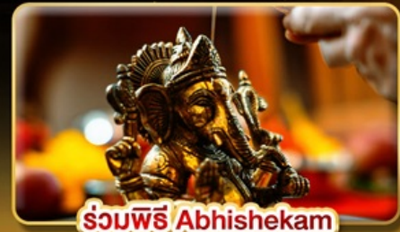
ร่วมพิธี Abhishekam