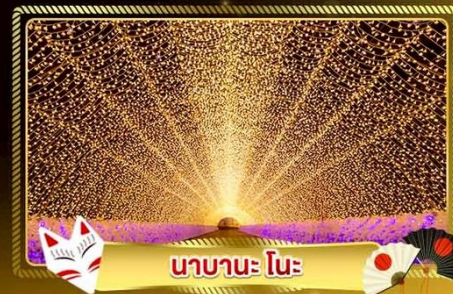
นานาเนะ โนะ