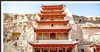
ถ้ำม่อเกาถู