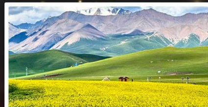
ทุ่งหญ้าจีเหลียน