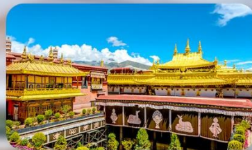
วัดโจคัง