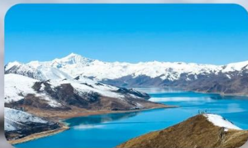
ทะเลสาบยิมดรก