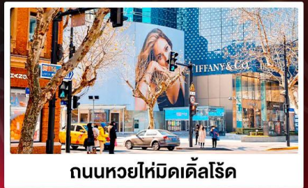
ถนนหวยไห่มีดเคิลโรด