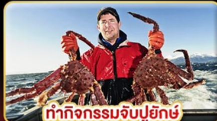
ทำกิจกรรมจับปูยักษ์ “พร้อมเมนูสุดพิเศษ”