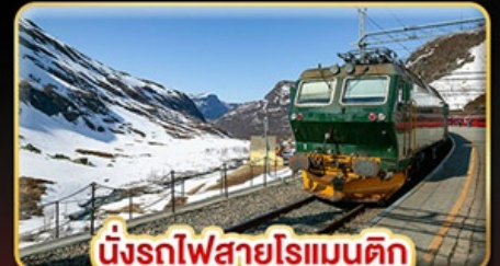
นั่งรถไฟสายโรแมนติก “พร้อมสปา”