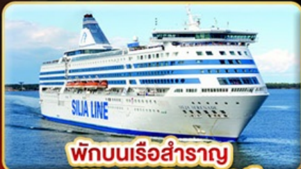
พักบนเรือสำราญ แบบ Window Room 2 คืน