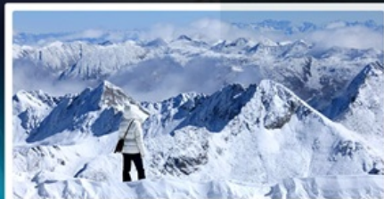
ต้ากู่ปิงชวน