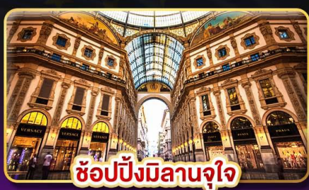
ช้อปปิ้งมิลานจุใจ

📅 เดินทาง : 9-16 ก.พ. / 9-16 มี.ค. / 23-30 มี.ค. 68