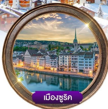
เมืองซูริค