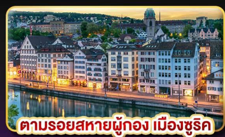
ตามรอยสหายผู้กอง เมืองลูซริก