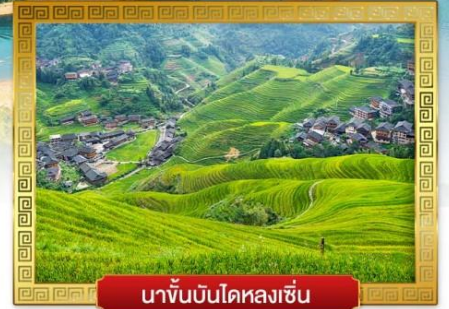
นาขั้นบันไดหลงเซ็น