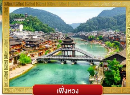
เฟิ่งหวง