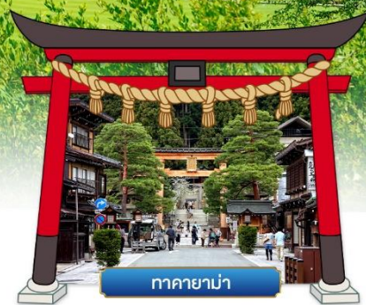
ทาคายามา