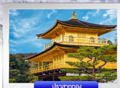
ปราสาททอง