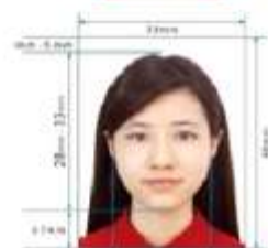
35mm x 45mm Paper Photo for Visa Application Form