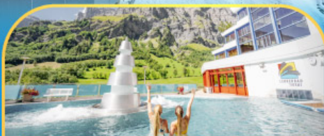
แช่น้ำแร่ร้อนผ่อนคลายลวยคอร์สวิต