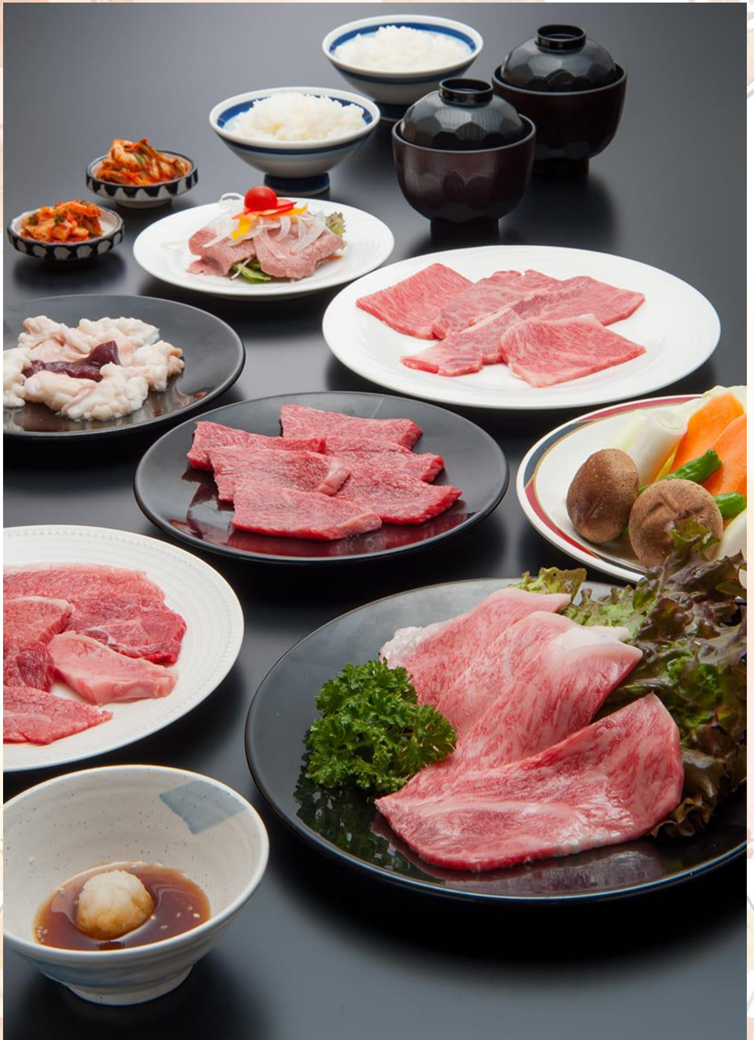
GO2KIX-TG086 -- ย้อนรอยเมืองเก่า โอซาก้า นารา เกียวโต มิเอะ เสน่ห์ที่ต้องตกหลุมรัก 6 วัน 4 คืน โดยสายการบินไทย [TG]