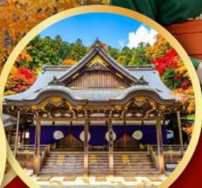
ศาลเจ้าอิสะ