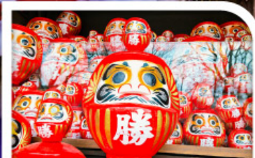
วัดแห่งชัยชนะ: วัดคัตสึโฮจิ(วัดคารุมะ)