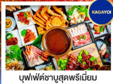
บุฟเฟ่ต์ชาบูสุดพรีเมียม