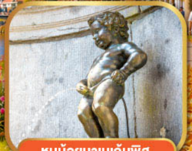
หูน้อยมานกันพิส