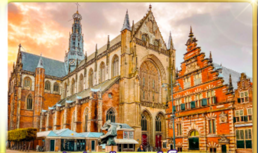
จัตุรัสเมืองฮาร์ลิม

พรมแดนเมืองแปลกเนเธอร์แลนด์และเบลเยียม เคนเมืองเคลฟท์ เมืองเครื่องปั้นดินเผาระดับโลก ฮาร์ลิมเมืองมั่งคั่งที่สุดของเนเธอร์แลนด์