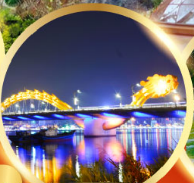
สะพานมังกรพันไฟ