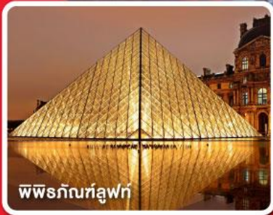
พิพิธภัณฑ์ลูฟว์