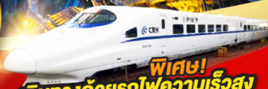
พิเศษ! เดินทางด้วยรถไฟความเร็วสูง