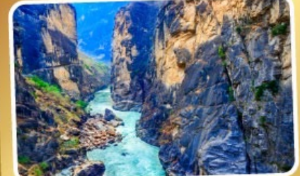
ช่องแคบเสื่อกระโจน

เมนูพิเศษ ! สุกี้ปลาแซลมอน สุกี้เห็ด อาหารกวางตุ้ง