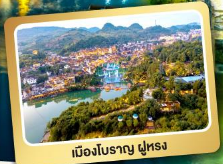
เมืองโบราณ ฝูหลง