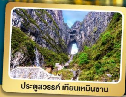
ประตูสวรรค์ เทียนเหมินซาน