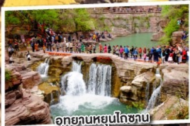
อุทยานหยุ่นโกซาน