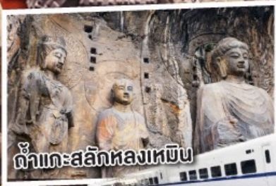
ถ้ำแกะสลักหลงเหมิน