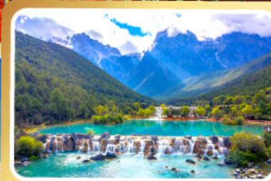
หุบเขาน้ำเงินทะเลสาบไป๋สุยเหอ