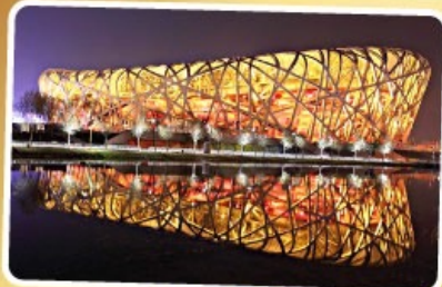
สนามกีฬารังนก