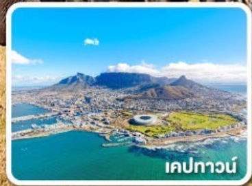
เคปทาวน์