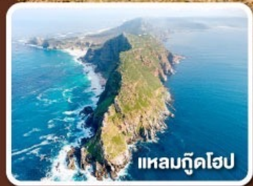
แหลมกู๊ดโฮป