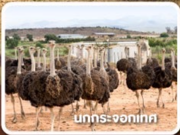
นกกระจอกเทศ