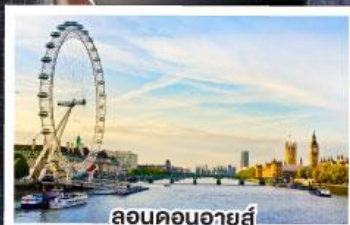
ลอนดอนอายส์

เดินทาง 12-20 ต.ค. 67 15-23 พ.ย. 67 27 ธ.ค. 67-04 ม.ค. 68 10-18 ก.พ. 68 11-19 มี.ค. 68