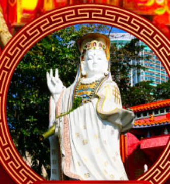
เจ้าแม่กวนอิม รัฟส์เบย์