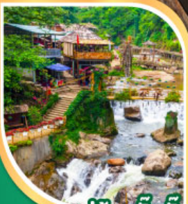
หมู่บ้านก๊ตก๊ต