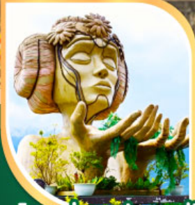
โมอาน่า ซาปาคาเฟ่