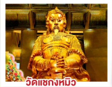
วัดแควงหมิว