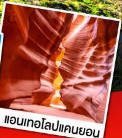
แอนทอปแคนยอน