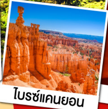
โบรซ์แคนยอน