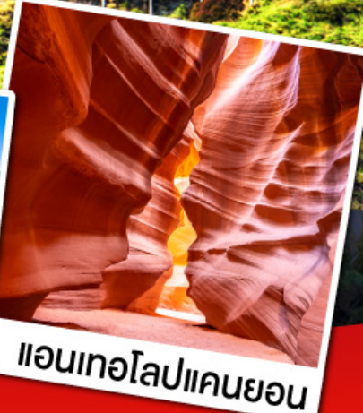
แอนเทอโลปแคนยอน