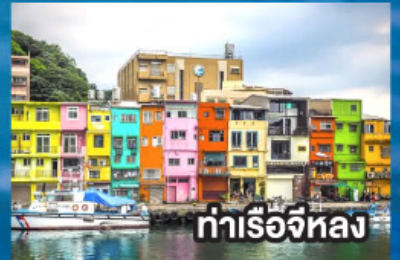
ท่าเรือจีหลง