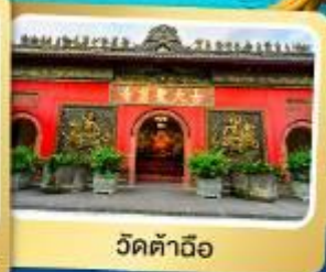
วัดต้าฉือ