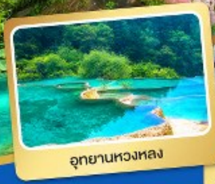
อุทยานหวงหลง