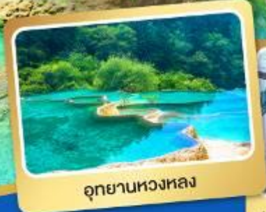
อุทยานหวงหลง