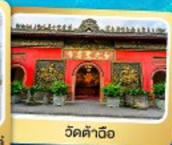
วัดต้าอ้อ