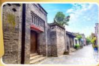
ถนนโบราณชอยกวางชอยแค