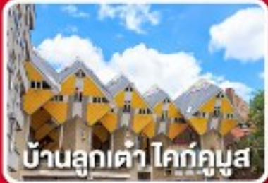
บ้านลูกเต่า โคก์กูซุส

เยือนเมืองเปลกดินแดน 2 ประเทศ บาร์ล-นัสซา บาร์ล-เฮร์ตโก