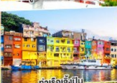
ล่องเรือทะเลสาบสุริยันจันทรา