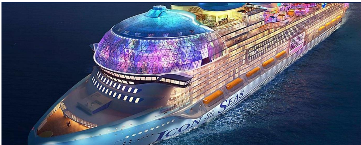
QQCRMIA-RC025 – Icon Of The Seas - “ Western Caribbean & Perfect Day” 8 วัน7 คืน Miami