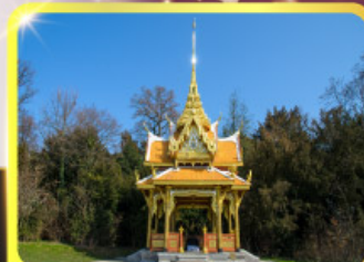
ศาลาไทยไชยานันท์