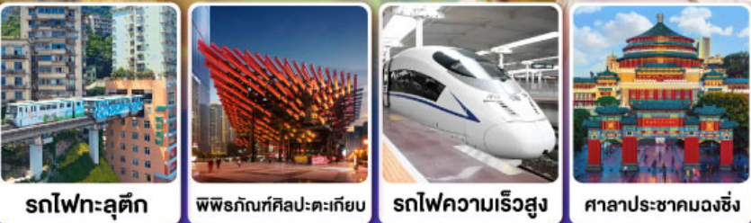
รถไฟทกะลุติค