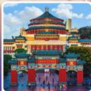
ศาลาประชาคมฉงชิ่ง