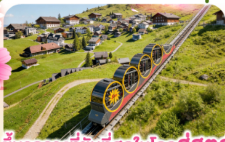
ขั้รรางที่ชันที่สุดในโลกสู่สตุส

พิชิตยอดเขาชุนเนกกา 1 ในเขาที่สวยงามที่สุดเมืองเซอร์แมท