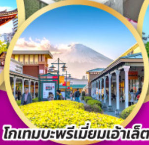
โทเกมบะพรีเมียมเอ้าเล็ท